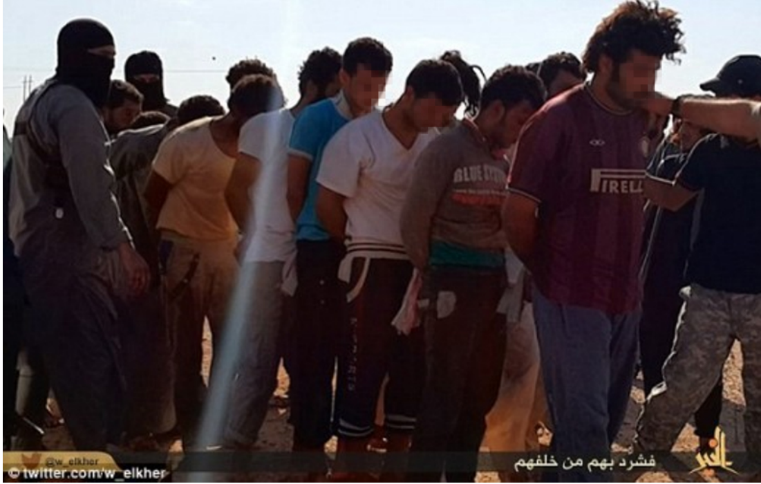
لقطة من فيديو داعش، المصدر الأصلي "تويتتر"، أغسطس/آب 2014.

داهموا المستشفيات ومنازل من بقوا. قام داعش بتصوير أعضائه وهم يعدمون العديد من سكان المدينة. ظهرت مقاطع فيديو مروعة تُظهر قطع رؤوس العشرات من الرجال والفتيان من الشيعيات على الإنترنت في أغسطس/آب. 2014 108 ووصف أحد المراقبين مقاطع الفيديو بأنها "ربما أكثر عمليات القتل الجماعي التفصيلية للسنة على أيدي داعش". 109