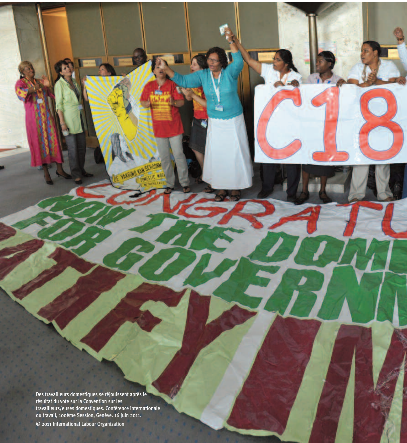
Des travailleurs domestiques se réjouissent après le résultat du vote sur la Convention sur les travailleurs/euses domestiques. Conférence internationale du travail, 100ème Session, Genève. 16 juin 2011.